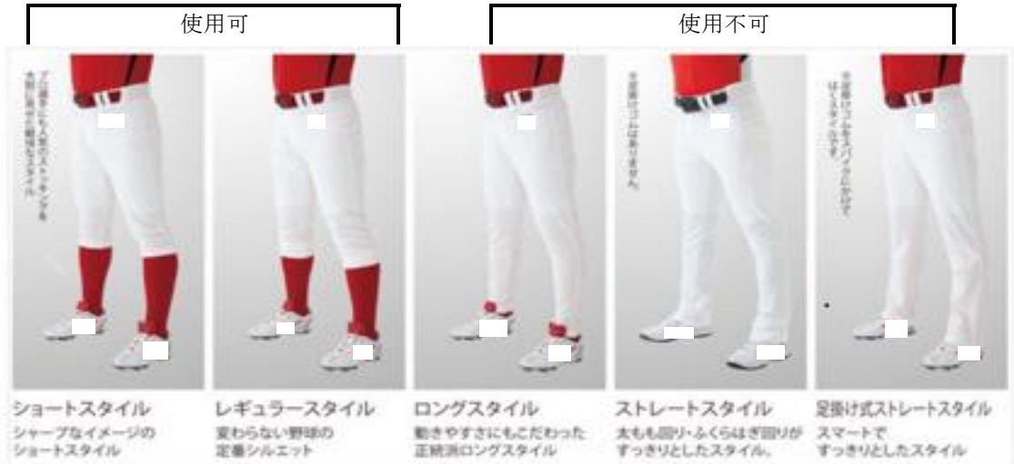
ユニフォームパンツの使用可否の参考図

(11) 参加申込書（登録原簿）提出後の選手の変更、追加登録及び背番号の変更は認めない。